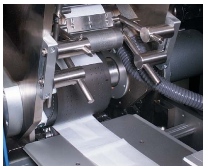
Schneiden, Falten und Überlappen des Schutzpapiers quer zur Maschinenlaufrichtung

Ausführliche Informationen finden Sie in der Broschüre „Systemlösungen für bahnerzeugende Materialien“