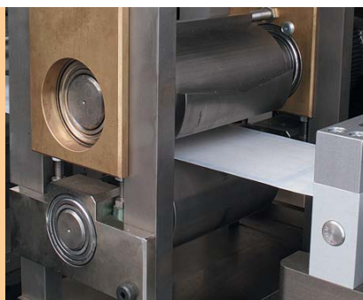
Kaltsiegelwalzen zur Siegelung der Beutelfolie